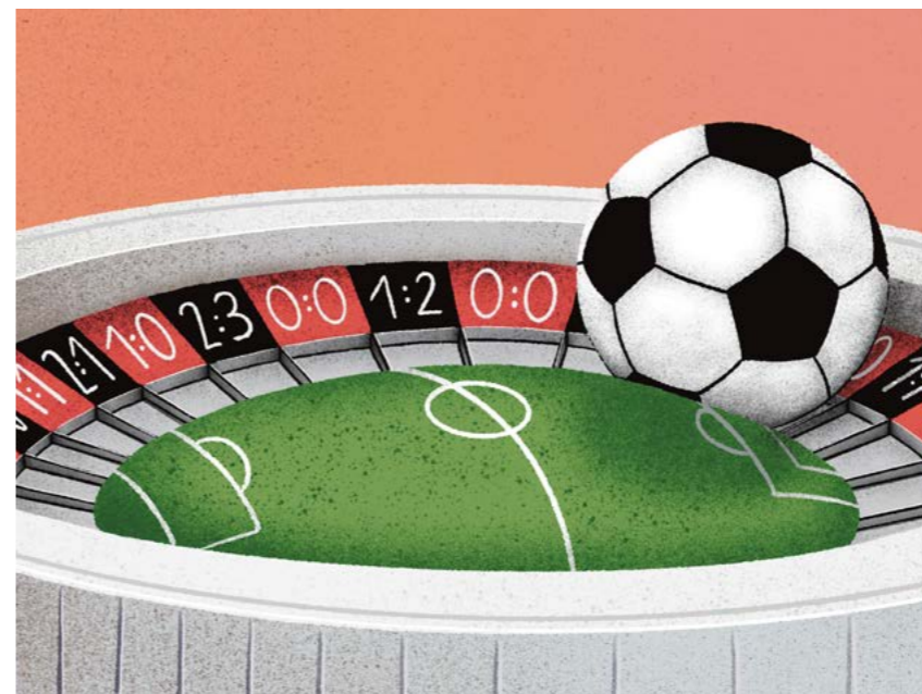
Illustration: Lena Gelegger

gern die Bühne einer stimmungsvollen Fankurve nutzen. Sie filmen sich dann selbst dabei, wie sie das Spiel verfolgen, geben Kommentare ab und „fiebern“ mit. Aktive Fans, Ultras und Co. stellen sich klar gegen solche Umtriebe, die in erster Linie selbstdarstellerischen Motiven geschuldet sind, anstatt der Liebe zu einem Verein oder einem Nationalteam. Zum Fußball zu gehen ist unter anderem auch eine Art Eskapismus, um vor den Sorgen des Alltags und der Weltenlage zu fliehen. Man nimmt ihn als Gemeinschaftserlebnis wahr und als Gefühl, Teil von etwas zu sein, das einem wichtig ist. Daher: Leben, fühlen, atmen wir das Stadionerlebnis, anstatt dauernd zum Handy zu greifen, um zu filmen oder zu fotografieren. Denn echte Vereinsliebe, wahre Emotion kann kein Fünfzehn-Sekunden-Clip auf Social Media je vermitteln, und jede Erinnerung an einen brachialen Torjubel, bei dem sich Wildfremde innig umarmen, ist mehr wert als Likes, die morgen schon wieder vergessen sind.