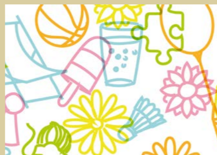
Bezahlte Anzeige Grafik: TASSKA

In der Hofpause verwandelt sich der Innenhof in eine bunte Oase am Fuße des Schlossbergs. Jung und Alt, Tourist:innen wie Bewohner:innen finden hier Raum zum Ausspannen, Spielen und Entdecken. Das Graz Museum legt einen besonderen Fokus auf die Themen Stadt und Demokratie. Kinder sind ausdrücklich willkommen, Jausnen erlaubt! Mehr Infos unter: www.grazmuseum.at/ausstellungen