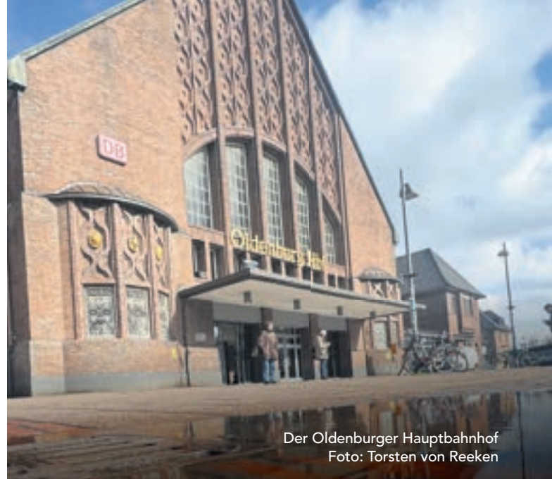
Der Oldenburger Hauptbahnhof

Ja, durchaus. So richtig gern hält man sich dort nicht auf. Das höre ich auch von vielen anderen. Aber man muss eben genauer hinschauen, woher dieses Gefühl kommt. Ein großes Problem ist die ständige Vertreibung. Die Szene wird am Bahnhofsvorplatz oder an anderen Treffpunkten immer nur sehr kurzfristig geduldet und dann weitergeschickt. Dadurch entsteht enorme Unruhe. Die Menschen kommen gar nicht zur Ruhe, müssen ständig da-