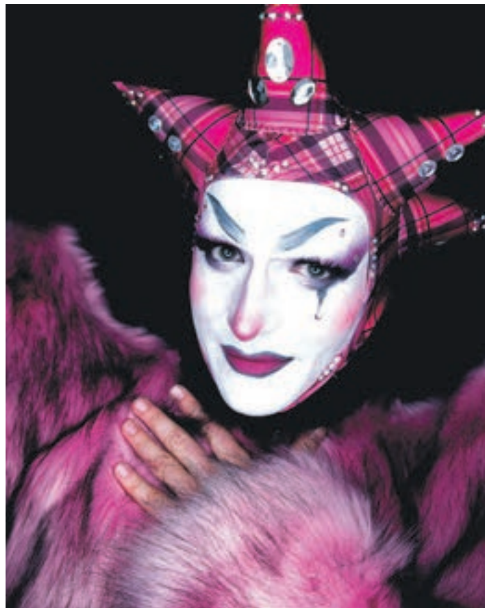
Harpy Fatale (she/her) – Trans Femme with muscles

Es ist schwer, es allen recht zu machen. Es gibt so viele bunte Variationen und Erwartungen innerhalb der Community. Die FLINTA-Person vermisst mehr Frauen, der Ledermann mehr Kerle. Die Musik ist mal zu laut, mal zu leise. Wir sind ein Team von acht Leuten. Wir alle haben eigene Vorlieben und Grenzen. Deshalb betonen wir immer wieder: Die Schwule Sau und anders queer e.V. existieren für die Community. Wir wollen nichts vorschreiben – im Gegenteil, jede*r soll bei uns aktiv mitgestalten. Was uns fehlt, ist, dass mehr Leute aus all diesen verschiedenen Szenen aktiv werden. Wir können schlicht nicht alles abdecken und nicht für jede Subkultur die perfekte Party aus dem Boden stampfen.