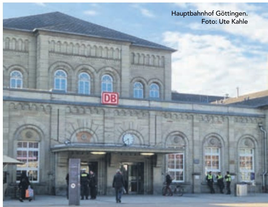
Hauptbahnhof Göttingen.