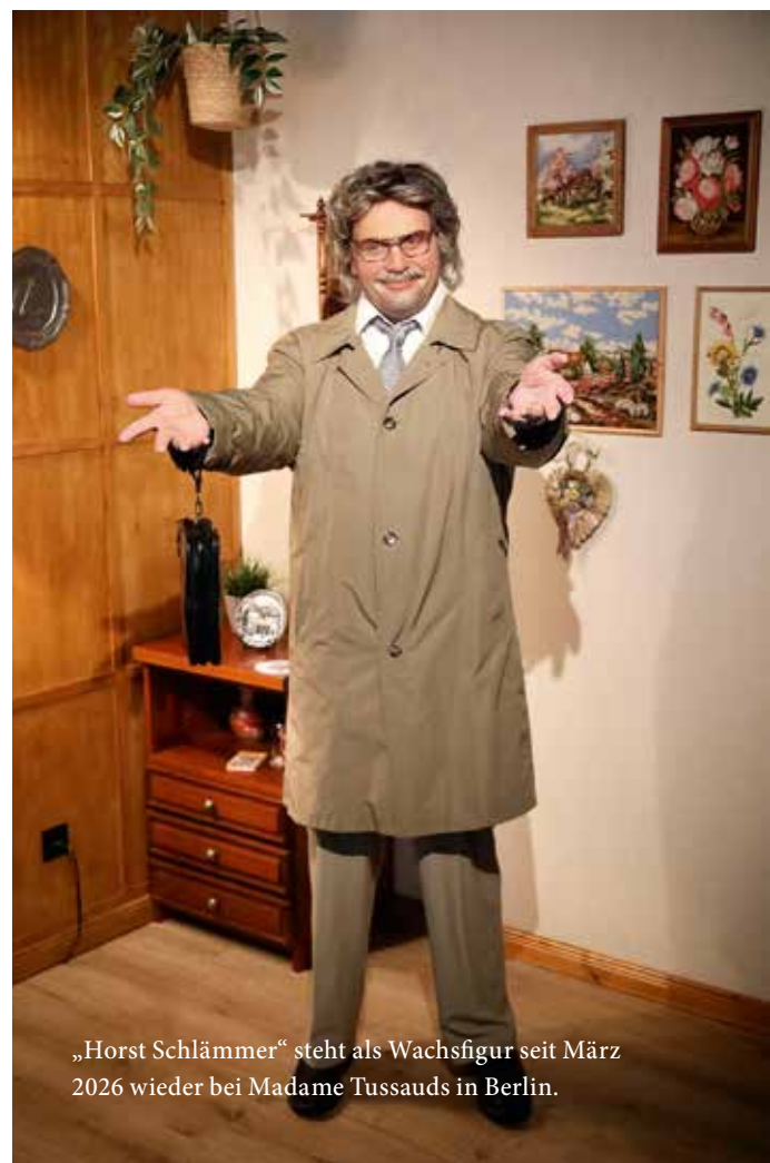
„Horst Schlämmer“ steht als Wachsfigur seit März 2026 wieder bei Madame Tussauds in Berlin.

Von Max Florian Kühlem