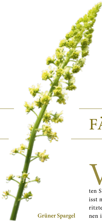
Grüner Spargel mit Färber-Wau

500 g grünen Spargel waschen und die untere Hälfte schälen.