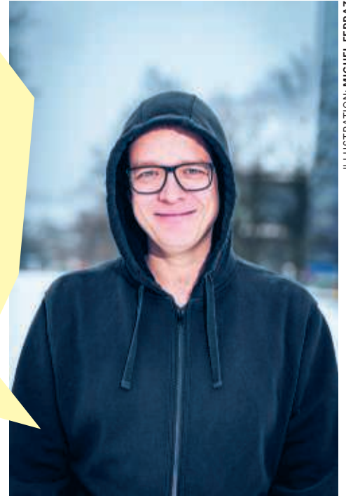
ILLUSTRATION: MIGUEL FERRAZ

HINZ & KUNZT, #396, FEBRUAR 2026, HAMBURG