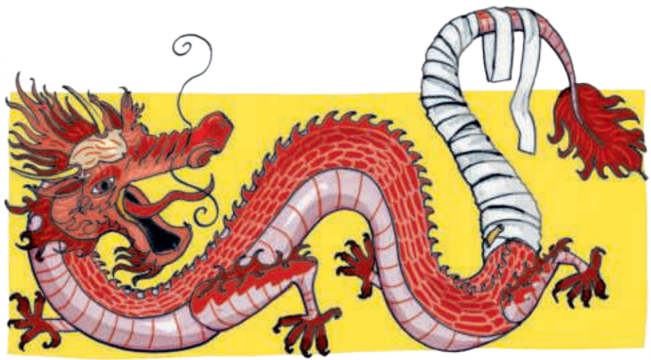
ILLUSTRATION: PRISKA WENGER

An dieser Stelle berichten wir über positive Ereignisse und Entwicklungen.